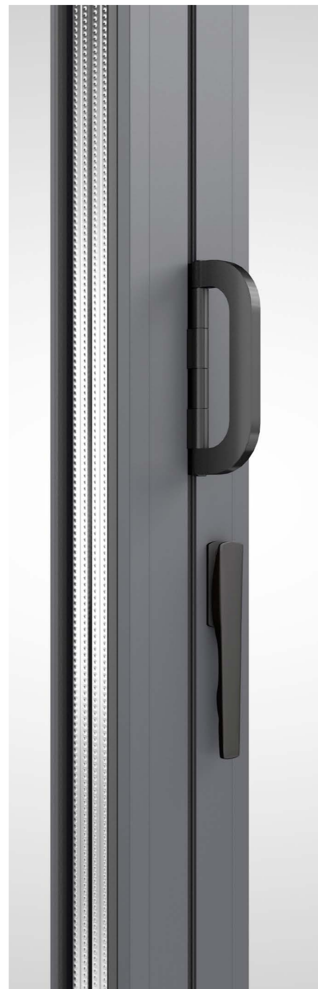
Klamka oraz uchwyt montowany do skrzydła.