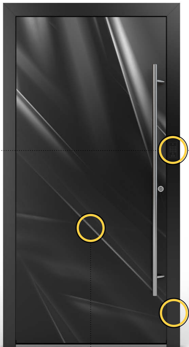
Model 15 | Wzór 1