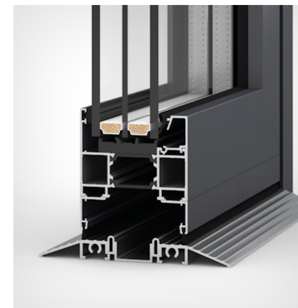
Próg płaski ze szczotkami