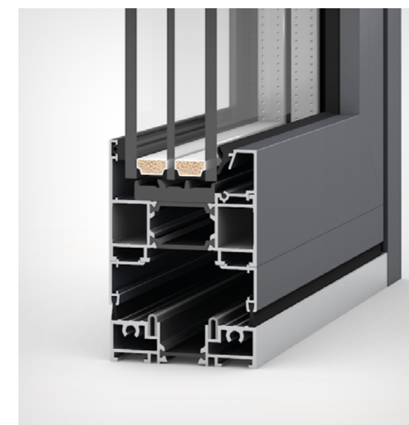
Próg niski ze szczotkami